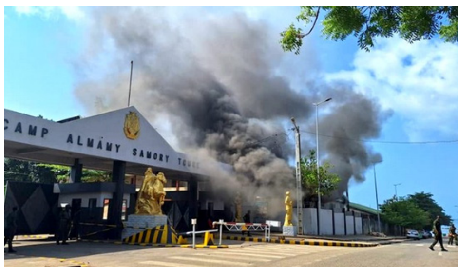
Incendie au camp Almamy Samory: le bâtiment annexe de l'entrée principale touché par les flammes